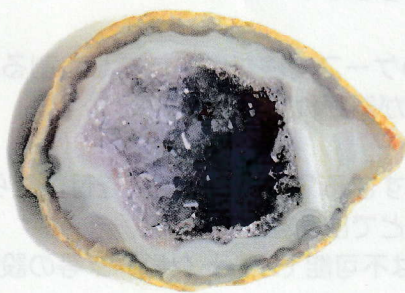
紫水晶 (アメジスト)