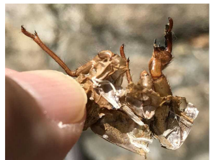
いろいろな虫を発見！