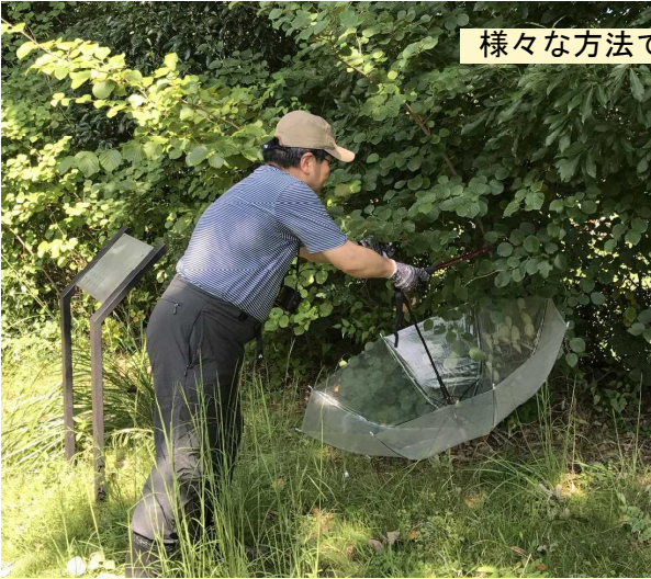
様々な方法で昆虫を採取します