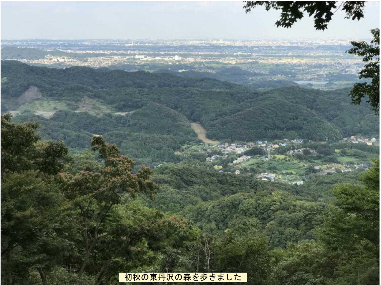
初秋の東丹沢の森を歩きました