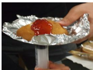
ジャムを使った火山噴火