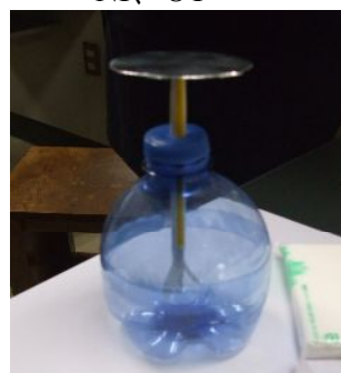
ペットボトル検電器